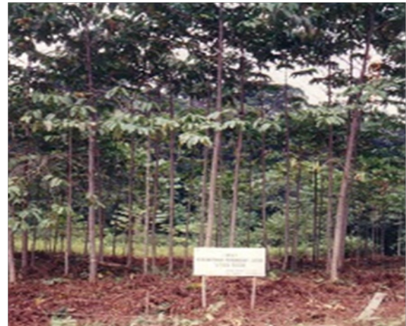
Gambar 3. Tanaman jabon ( Anthocephalus cadamba ) di lokasi penelitian