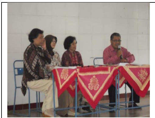
Gambar 2. Sambutan Kepala Padukuhan Karangmalang pada Acara Workshop

sebut disajikan pada Gambar 2, 3, 4, dan 5.