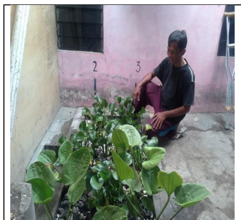
Gambar 9. Pemilik “Sekar Laundry” di Dekat Kolam IPAL

Setelah IPAL dioperasikan, kemudian dilakukan uji laboratorium terhadap sampel limbah laundry sebelum dan setelah melewati IPAL,