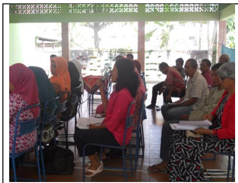
Gambar 4. Peserta workshop yang Terdiri dari Pemilik Usaha Laundry di Wilayah Dusun Karangmalang dan Kuningan, Depok, Sleman