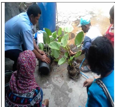
Gambar 7. Proses Pemindehan Tanaman Melati Air ke Kolam IPAL