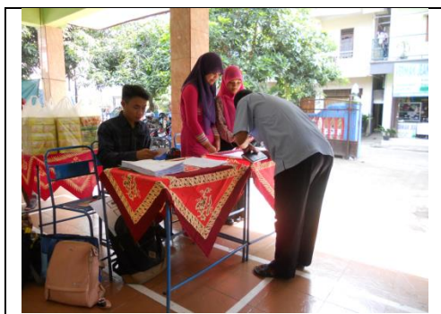
Gambar 5. Mahasiswa yang Terlibat dalam Kegiatan

Setelah pelaksanaan workshop , kemudian dilakukan pembuatan model IPAL sederhana di kedua mitra. Dokumentasi IPAL disajikan pada Gambar 6, 7, 8, dan 9.