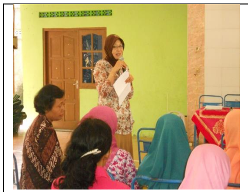
Gambar 3. Penyampaian Materi oleh Tim Pengabdian pada Acara Workshop