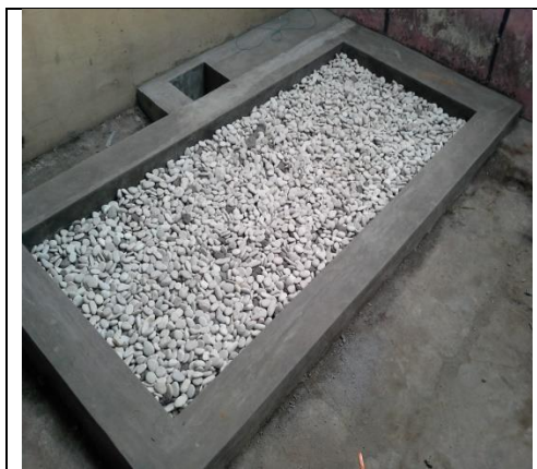
Gambar 6. Kolam IPAL Sebelum Diberi Tanaman Air