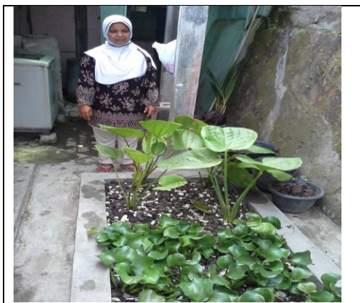
Gambar 8. Pemilik “Ramadhani Laundry” di Dekat Kolam IPAL