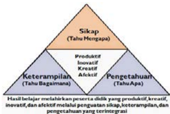
Bagan 3.2. Proses Pembelajaran Integratif pendekatan saintifik (Kemdiknas)

Penerapan pendekatan saintifik dapat dilakukan dalam konten materi sejarah lokal Banten tentang gerakan sosial Kyai dan Petani melawan pemerintah Hindia Belanda. Menurut Supardan (2004:262) pembelajaran sejarah lokal, perlu diperkenalkan pada siswa untuk mengenali identitas kelokalannya