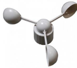
Gambar 2. Cup Anemometer.

berputar mangkuknya secara horizontal, putaran ini akan mengukur kecepatan angin dengan perbandingan antara banyaknya putaran dan interval waktu. [2]