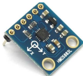
Gambar 3 Bentuk Fisik Sensor kompas HCM5883L

Sensor kompas HCM5883L adalah sensor digital pengukuran 3 sudut magnetoresistensif sensor. Sensor ini berukuran kecil, konsumsi daya rendah, akurasi bagus dan berulang, dan toleransi guncangan yang kuat diikuti harga yang terjangkau. Spesifikasi sensor kompas HMC588L[4]