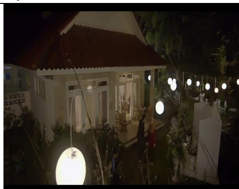
Gambar 9. Halte → Halaman Rumah

Senja mulai turun. Sekitar halte makin sepi. Satu-dua pedagang asongan yang mangkal mulai memberesi dagangan. Perhatian Ra tercuri sesaat, ketika seorang mahasiswa yang berdiri tak jauh dari mereka terlihat mendengus kesal karena bus yang ditunggu, belum juga datang.