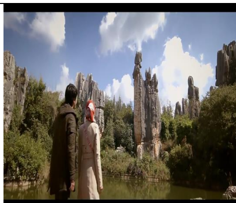
Patung Ashima, Yunnan