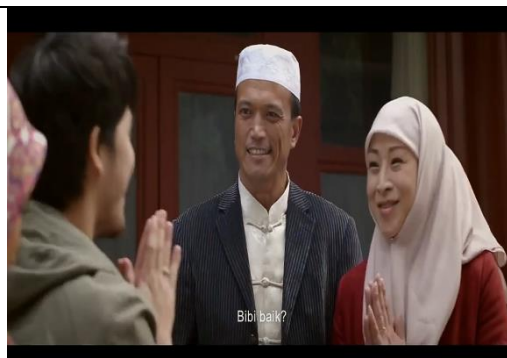
Paman dan Bibi Zhongwen