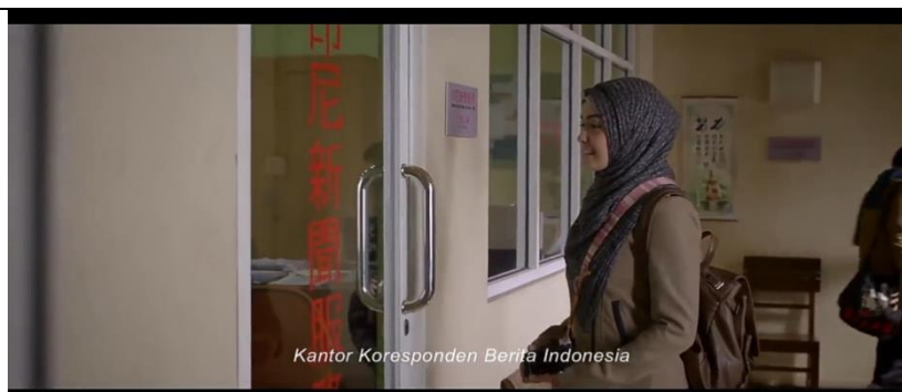
Kantor Koresponden Berita Indonesia, Beijing