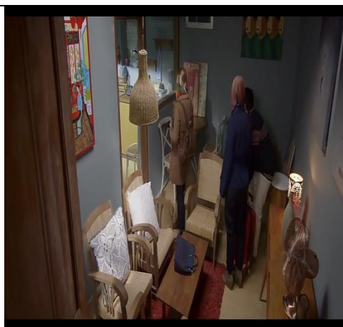
Gambar 12. Penginapan (Youth Hostel) → Apartemen

Ashima, apakah yang memberi gadis itu kekuatan untuk memercayakan hatinya hanya pada Ahei? Berakhir bahagiakah kisah cinta mereka? Penginapan sederhana yang AC-nya terlalu dingin membuat Asma merapatkan jaket. Kedua mata gadis itu masih merayapi layar netbook, sebelum kemudian menarik napas.