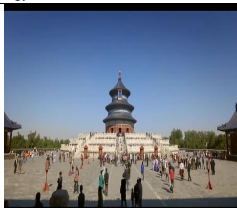
Temple of Heaven

Temuan penelitian proses ekranisasi yang muncul pada latar novel dan film "Assalamualaikum Beijing" terdapat tiga kategorisasi, yaitu: penciutan, penambahan, dan perubahan bervariasi. Proses ekranisasi pada latar ini berupa penciutan dan penambahan latar tempat serta perubahan bervariasi pada latar tempat dan waktu dari novel "Assalamualaikum Beijing" karya Asma Nadia menjadi film "Assalamualaikum Beijing" sutradara Guntur Soeharjanto. Kategorisasi penciutan terdapat 3 latar tempat dalam novel yang tidak terdapat dalam adegan film, yaitu: Tiananmen Square dan The Forbidden City, rumah Zhongwen, dan Candi Borobudur di Yogyakarta.