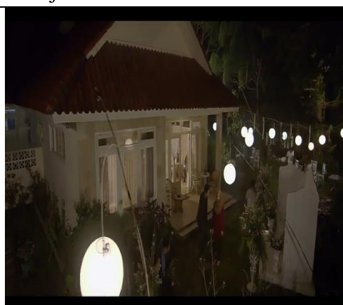
Gambar 10. Senja → Malam

Senja mulai turun. Sekitar halte makin sepi. Satu-dua pedagang asongan yang mangkal mulai memberesi dagangan. Perhatian Ra tercuri sesaat, ketika seorang mahasiswa yang berdiri tak jauh dari mereka terlihat mendengus kesal karena bus yang ditunggu, belum juga datang.