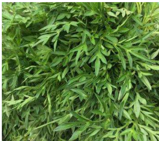
Gambar 1. Daun Kenikir ( Cosmos caudatus )

Berdasarkan pemampanan di atas, perlu segera dilakukan pencarian senyawa kimia yang mampu menggantikan peranan temephos sebagai larvasida. Pada penelitian ini, kami menggunakan ekstrak daun kenikir ( Cosmos caudatus ) berbagai fraksi sebagai larvasida nyamuk A. aegypti (Gambar 1). Tanaman ini dipilih dikarenakan kandungan senyawa kimia golongan saponin, flavonoid, terpenoid, alkaloid, tannin, dan minyak atsiri yang terkandung didalamnya. Berdasarkan penelitian terdahulu, golongan senyawa kimia tersebut dapat berfungsi sebagai larvasida (Syamsul & Purwanto, 2014).