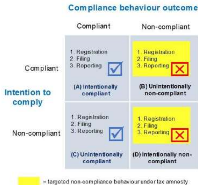
Gambar 4.2 Type Kepatuhan Pajak yang Menjadi Sasaran Program Tax Amnesty

Gambar matrik di atas menjelaskan bagaimana program tax amnesty mengakomodir wajib pajak yang mungkin karena ketidaktahuan atau alasan lain secara tidak sengaja belum melaporkan harta dari penghasilan yang belum dikenakan pajak dalam SPT PPh (kuadran B3— unintentionally non-compliant ) maupun wajib pajak yang di kuadran D3 ( intentionally non-compliant ), untuk pindah ke kuadran A3 dengan konsekuensi finansial yang rendah. Singkatnya, bisa dikatakan bahwa yang menjadi sasaran utama program tax amnesty ini, jika matriks perilaku kepatuhan digunakan sebagai acuan, adalah mereka yang berada di kuadran B (yang ketidakepatuhannya karena unsur ketidaksengajaan) dan D (yang memang sengaja tidak patuh) seperti terlihat dalam area kuning dalam Gambar 4.2.