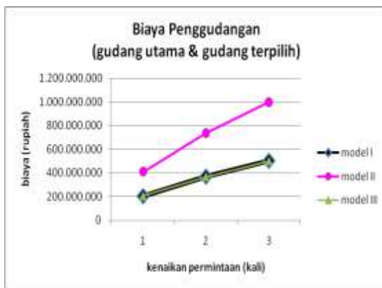
Gambar 4. Grafik perbandingan biaya pengudangan ketiga model

Berdasarkan hasil perhitungan pada Tabel 2, berikut akan diperlihatkan grafik dari setiap komponen total biaya operasional, sehingga akan diketahui faktor-faktor yang mempengaruhi perbedaan biaya setiap model.