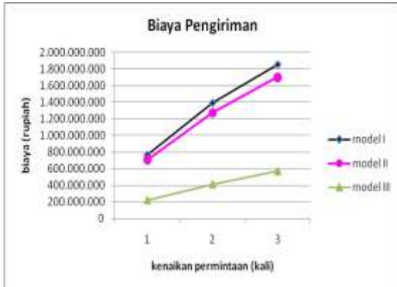
Gambar 6. Grafik perbandingan biaya pengiriman ketiga model