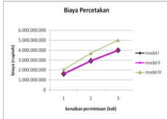
Gambar 7. Grafik perbandingan biaya percetakan ketiga model