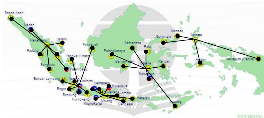
Gambar 2. Lokasi gudang terpilih dan UPBJJ-UT yang dilayaninya pada sistem distribusi bahan ajar tidak terpusat alternatif 2.