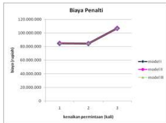
Gambar 5. Grafik perbandingan biaya penalti ketiga model