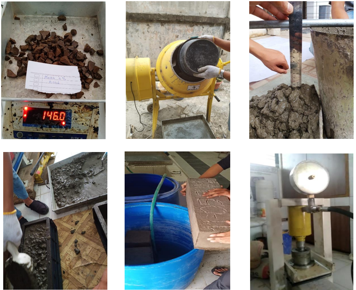
Gambar 2 : Pembuatan benda uji balok

Setelah sampel dibuat kemudian sampel di lakukan perawatan dengan memasukan kedalam bak perendam. Sampel di keluarkan minimal 8 jam sebelum