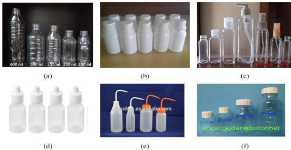
Gambar 1 : Botol Plastik PET