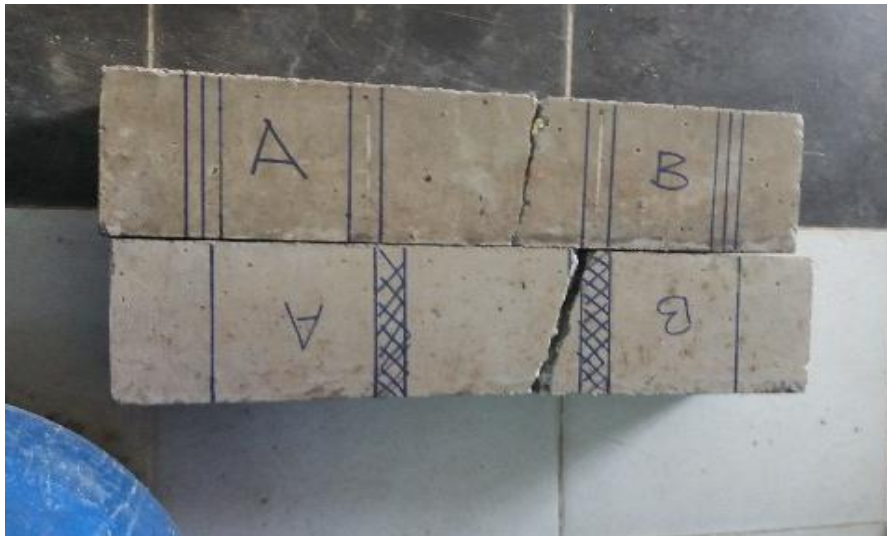
Gambar 3 : Sampel setelah di uji lentur

Setelah hasil uji kuat lentur didapatkan hasilnya, tahapan selanjutnya melakukan analisa mutu beton dengan hasil analisa sebagai berikut :