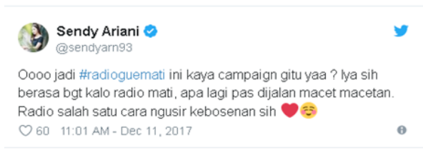
Gambar 3. (Komentar Warganet di Twitter, 2019)

Setelah siaran radio serentak dihentikan di 37 stasiun radio, lalu 15 menit kemudian, pukul 08.00 serentak ke-37 stasiun radio itu mengudara kembali dengan memutar lagu Indonesia Raya. Selanjutnya, setelah lagu Indonesia Raya terdengar suara Presiden RI Joko Widodo yang mengatakan “ Emang enak enggak ada radio? Saya Joko Widodo, pendengar radio. ”