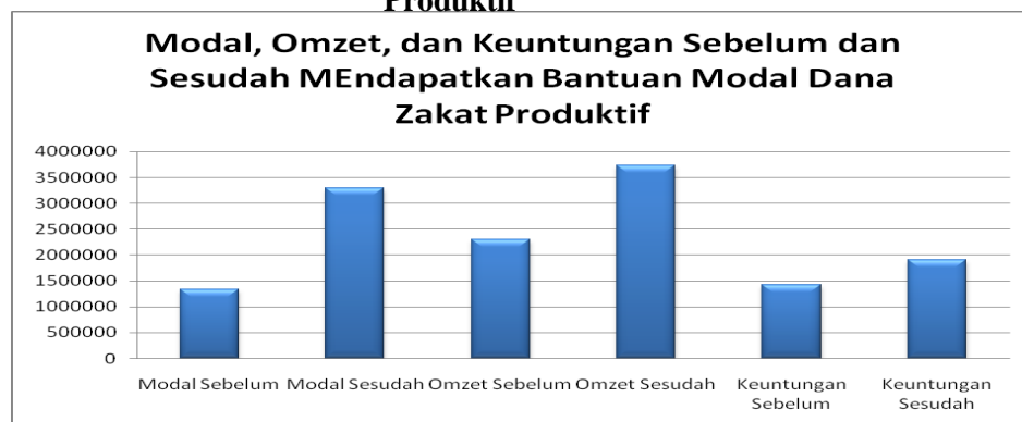
Gambar 4 Rata-rata Modal, Omzet dan Keuntungan Sebelum dan Sesudah adanya Bantuan Dana Zakat Produktif

Bantuan modal dari dana zakat produktif ini memberikan peranan penting bagi usaha mikro mustahik. Mustahik yang mengalami kendala modal dapat dibantu dengan dana zakat produktif. Karena mayoritas mustahik tidak berani meminjam modal kepada lembaga formal seperti bank ataupun koperasi karena adanya jaminan/anggunan.