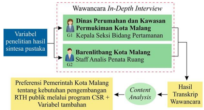
Gambar 2. Bagan Alur Penelitian.

Untuk dapat menentukan preferensi Pemerintah Kota Malang terhadap pengembangan RTH publik melalui program CSR berdasarkan preferensi Pemerintah Kota Malang dilakukan wawancara in-depth interview .