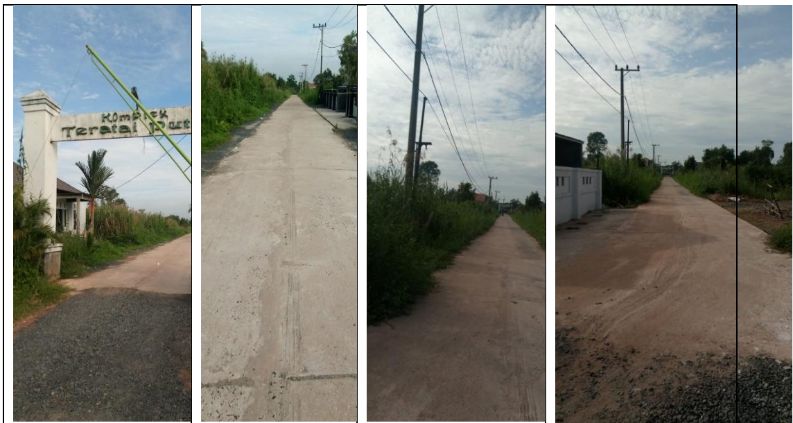
Gambar 1. Jalan Lingkungan Perumahan Komplek Teratai Putih Kalimantan Selatan

Proyek konstruksi jalan lingkungan type kaku atau rigid. Pekerjaan semenisasi jalan di Perumahan Komplek Teratai Putih Kalimantan Selatan dengan panjang 200 meter, lebar 7 meter dan tebal 20 cm. Jalan ini menjadi satu satunya akses masuk dan keluar kompleks Teratai Putih. Kalau musim hujan akan terasa berat jalannya dengan medan becek tanah merah dan bergelombang dan musim kering berdebu tanah merah dan bergelombang jalannya sehingga tidak terasa nyaman dilalui. Jalan ini terhubung ke jalan raya Trans Kalimantan.