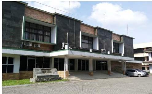
Gambar 3.1 Gelanggang Mahasiswa USU

Dari hasil penelitian dan perhitungan yang telah dilakukan diperoleh data sebagai berikut: