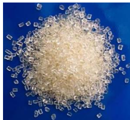
Gambar 2. Polypropylene