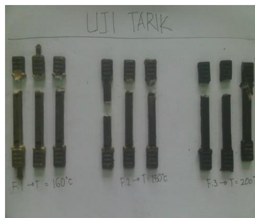
Gambar 2. Spesimen hasil proses Uji Tarik

Setelah proses pengujian selesai dilakukan, maka tahap selanjutnya akan dilakukan pengukuran akhir terhadap spesimen sehingga dapat diketahui perubahan spesimen tersebut.