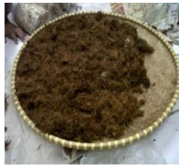
Gambar 1. Serat Tandan Kelapa Sawit

Dalam proses penelitian ini akan menggunakan campuran bahan baku yang terdiri dari serat tandan kelapa sawit, polypropylene dan polystyrene .