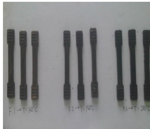
Gambar 1. Spesimen hasil proses Injection Moulding