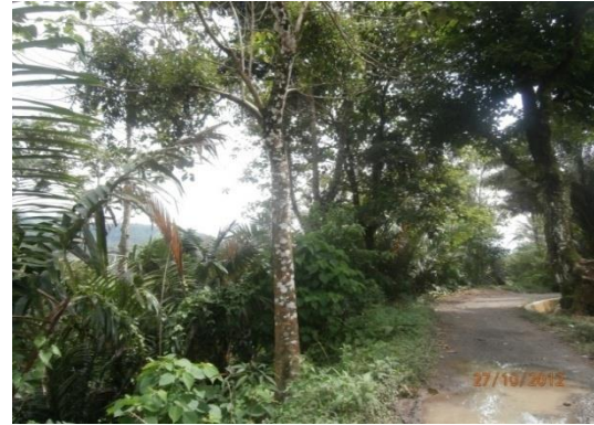
Gambar 3. Pola Agrisilvikultur Tanaman Hutan dan Salak

Pada pola agrisilvikultur di desa ini terdapat komponen tanaman kehutanan dengan komponen tanaman pertanian. Kombinasi pada pola ini meliputi komponen kehutanan seperti Gmelina dan durian serta komponen pertanian seperti salak, cabai, coklat, jagung, kelapa, kopi, kunyit, mangga, nenas, pinang, pisang, serai dan ubi kayu.