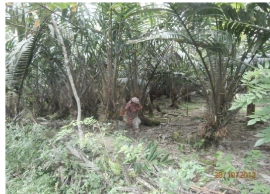
Gambar 1. Pemeliharaan Salak dengan cara Pemotongan Tunas

Pemeliharaan yang dilakukan masyarakat pada tanaman atau lahan pertanian mereka masih sangat sederhana. Hal ini dibuktikan dengan minimnya perawatan yang dilakukan baik berupa pemupukan, pemangkasan dan penjarangan tanaman. Pemeliharaan tanaman salak yang sering dilakukan adalah ketika waktu pemanenan buah salak, yaitu dengan cara memotong cabang tunas yang tumbuh pada batang salak tersebut sehingga tunas salak yang dimaksud tidak tumbuh lagi dan dapat dilihat pada Gambar 1.