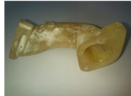
Gambar 2. Intake Manifold Komposit Serat Nanas

cetak dan mengepresnya dengan menggunakan baut pengunci pada rangka cetak. Setelah itu dibiarkan selama 24 jam supaya mendapatkan kekerasan yang maksimal barulah intake manifold komposit serat nanas diambil dari cetakannya. Untuk menyempurnakan bentuknya maka dilakukan proses finishing , dengan cara mengamplas permukaan luar intake manifold hingga didapatkan hasil yang baik dan Mengebor bagian-bagian yang akan dipasang baut dan saluran vakum bahan bakar.