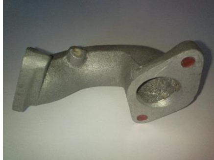
Gambar 1. Intake Manifold Standar

intake manifold . Kemudian kedua rangka cetak tersebut dipisahkan dan intake manifold standar yang ada di dalamnya diambil dengan perlahan agar cetakan tidak rusak.