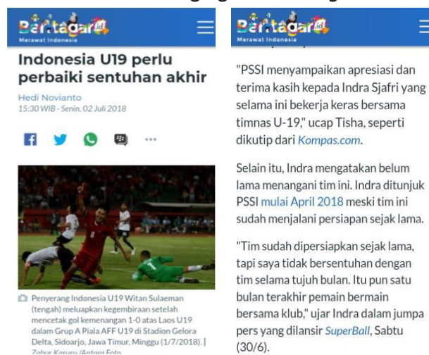
Gambar 2. Berita Hasil Agregasi di Beritagar.id

Ketika dikonfirmasi hasil analisis isi berita yang tidak memberikan linkback , maka informan 3 menggambarkan bahwa Beritagar.id melakukan peran sebagai aggregator dan curator berita, dan kedua peran ini berbeda dalam penyajian beritanya sesuai yang ditampilkan pada gambar 1 dan 2.