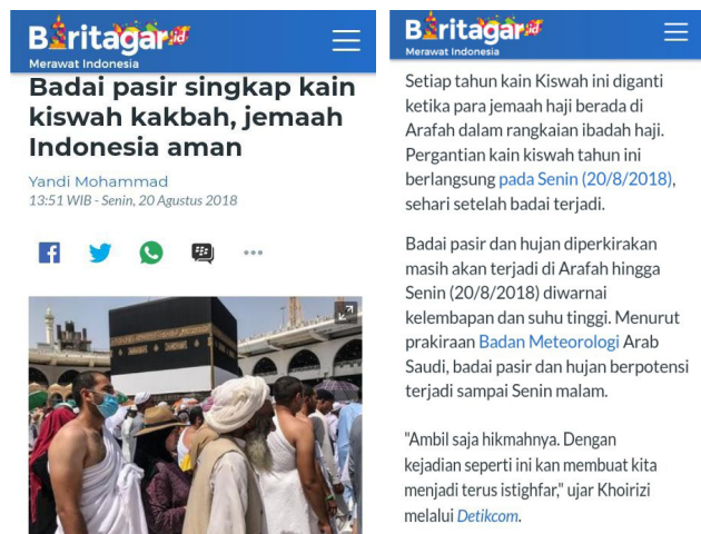
Gambar 3. Berita Hasil Kurasi di Beritagar.id