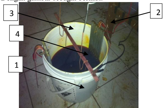
Gambar 1. Pelapisan Besi dengan logam Cr