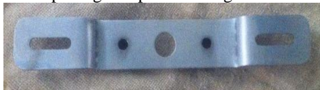
Gambar 2. Besi terlapis Cr 5V 8A

Proses chrom plating dilakukan selama 60 menit dalam larutan elektrolit kapasitas 5 liter dengan hasil chrom plating didapatkan sebagai berikut: