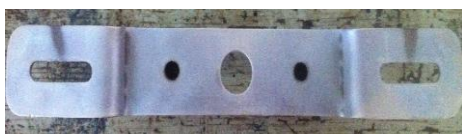
Gambar 4 Besi terlapis Cr 6V 8A

Pengujian menggunakan spektrometer menghasilkan prosentase kandungan dari berbagai bahan kimia, sehingga pengambilan nilai kandungan chromium dalam penelitian ini diambil dalam bentuk nilai prosentase. Uji spektrometer mendapatkan spektrum cahaya pada benda uji dengan menggunakan gas argon sebagai pemanas sekaligus penembak pada benda yang akan diujikan. Pengujian menggunakan spektrometer hanya bisa dilakukan apabila permukaan logam yang akan diujikan tidak terkontaminasi Co 2 atau udara bebas yang membuat logam tertutup oleh zat yang dapat membuat bahan uji tidak dapat terbaca seperti misalnya adanya lemak.