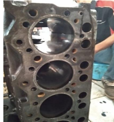
Gambar 1. Water jacket

Hasil pemeriksaan : Water jacket berkerak Cara mengatasi : Membersihkan water jacket Kesimpulan : Baik