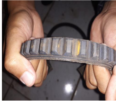
Gambar 6. Tali Kipas

Hasil pemeriksaan : Tidak ada retakan pada tali kipas