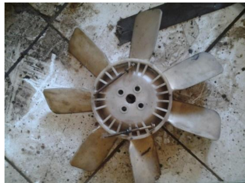
Gambar 7. Kipas Pendingin

Kesimpulan : Kondisi kipas pendingin masih baik.