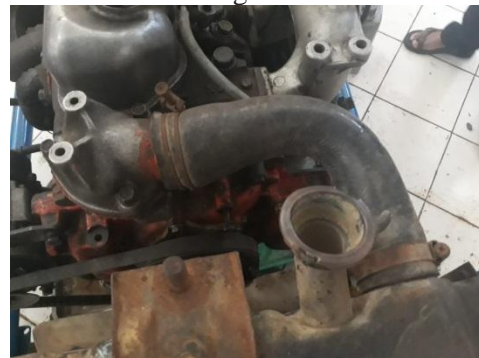
Gambar 3. Selang

Hasil pemeriksaan : - Klem berkarat - Kondisi selang masih bagus