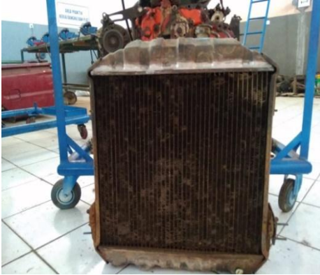
Gambar 4. Radiator