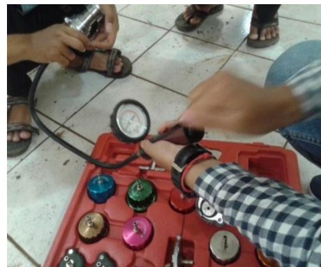
Gambar 8. Pengecekan Tekanan Tutup Radiator