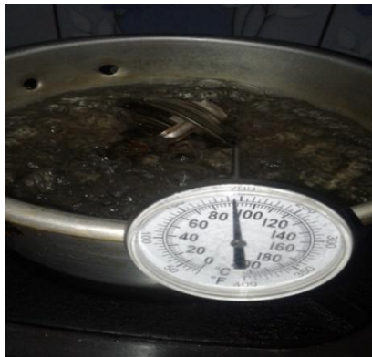
Gambar 5. Merebus Thermostat