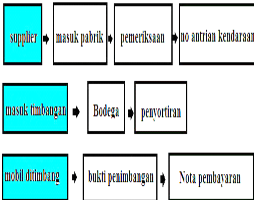
Gambar 2. Alur Penerimaan Bahan Baku Sumber: Olahan Data, 2017

Selanjutnya, bahan baku kelapa yang telah sampai ke perusahaan, juga harus melewati tahap-tahap dalam proses penerimaan bahan baku kelapa. Alur penerimaan bahan baku kelapa dijelaskan sebagai berikut :