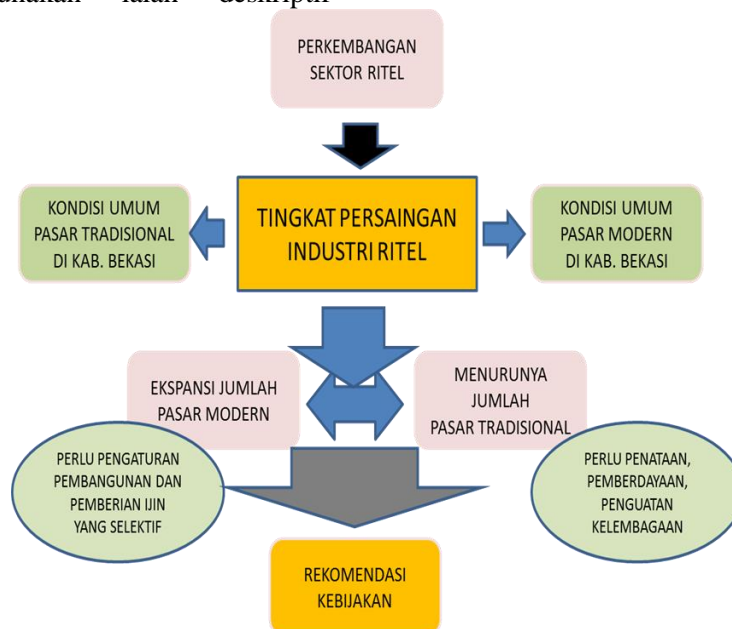
Gambar 1 Kerangka Pemikiran

analisis, yaitu penelitian yang menggambarkan secara jelas dan menganalisis mengenai implementasi dari beberapa kebijakan daerah yang berkaitan dengan pola Perlindungan, Pemberdayaan, dan Penataan Kelembagaan Pasar Tradisional serta Penataan Pembangunan Pasar Modern di Kabupaten Bekasi serta dampak dari implementasi kebijakan tersebut bagi eksistensi pasar tradisional di Kabupaten Bekasi. Dasar penelitian yang digunakan ialah kualitatif yang menggambarkan secara jelas mengenai variabel yang mempengaruhi implementasi kebijakan yang berkaitan dengan kasus penelitian ini, seperti isi kebijakan dalam hal ini tujuan dan sasaran, aktor aktor yang terlibat, mulai dari pemerintah daerah dalam hal ini dinas terkait, DPRD, Organisasi Pedagang Pasar Tradisional, pengusaha pasar modern, dll, khususnya dalam penerapan Perda Nomor 8 Tahun 2001 Tentang Perlindungan, Pemberdayaan Pasar Tradisional dan Penataan Pasar Modern di Kabupaten Bekasi .