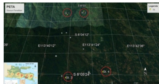
Gambar 2. Posisi koordinat empat stasiun penelitian

Parameter fisika dan kimia air sungai diukur secara in situ . Parameter fisika yang diukur meliputi debit, kecerahan, suhu, warna, dan bau air sungai, sedangkan parameter kimianya meliputi oksigen terlarut (DO) dan pH.