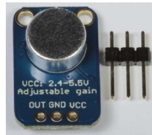
Gambar 2. Sensor suara MAX4466

Sensor suara MAX4466 memiliki mikrofon dengan sensitifitas sebesar -56 dB (CUI, 2008). Bentuk fisik dari sensor suara MAX4466 ditunjukkan pada Gambar 2.