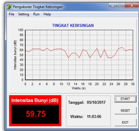
Gambar 6. Tampilan aplikasi saat pengukuran intensitas bunyi