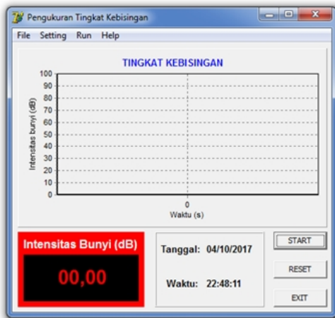
Gambar 4. Tampilan aplikasi pengukuran tingkat kebisingan

Hasil perancangan software pengukuran tingkat kebisingan ditunjukkan pada Gambar 4. Tombol START berfungsi untuk mengaktifkan port serial sehingga proses pengambilan data dari mikrokontroler dimulai. Tombol RESET berfungsi untuk menghapus grafik. Tombol EXIT berfungsi untuk keluar dari program aplikasi.