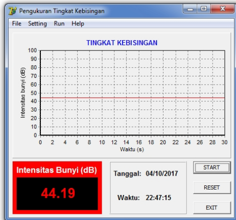
Gambar 5. Tampilan aplikasi saat pengujian sensor suara

Langkah selanjutnya yaitu pengujian sensor suara MAX4466. Pengujian dilakukan di dalam sebuah ruangan. SLM yang digunakan untuk kalibrasi menggunakan SLM pada Multifunction Enviroment Meter (MEM) KW06-291 4 in 1. Saat pengujian, pengukuran menggunakan SLM tersebut dilakukan secara bersamaan dengan pengukuran menggunakan sensor suara MAX4466. Tampilan hasil pengukuran menggunakan sensor suara MAX4466 ditunjukkan pada Gambar 5.