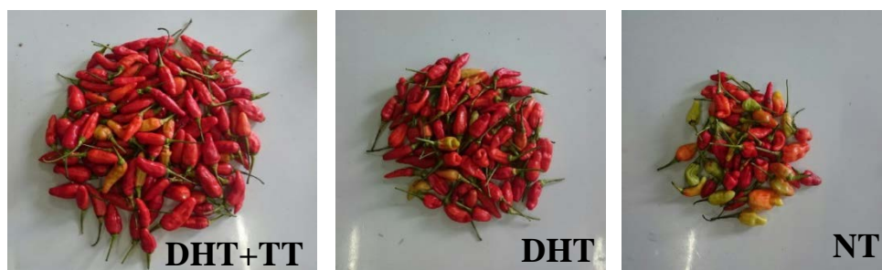
Gambar 3.3 Rata-rata hasil panen periode maksimum pada DHT+TT (periode kedua), DHT (periode kelima), dan Kontrol (NT) (periode ketiga).

Pemanenan pertama dilakukan pada saat tanaman berumur 74 hst, dan panen selanjutnya dilakukan setiap dua minggu sekali sampai panen sebanyak delapan kali. Pengamatan terhadap delapan kali panen cabai didapatkan hasil panen tertinggi terdapat pada DHT+TT 17,21 ton/ha yang diikuti oleh DHT 10,66 ton/ha dan paling rendah ditunjukkan oleh kontrol (NT) 6,70 ton/ha. Hasil analisis sidik ragam menunjukkan bahwa hasil panen pada DHT+TT berbeda nyata dengan DHT dan kontrol (NT), berdasarkan uji Duncan's pada taraf 5% (Tabel 3.4). Grafik periode panen pada tiap perlakuan dapat dilihat pada Gambar 3.3.