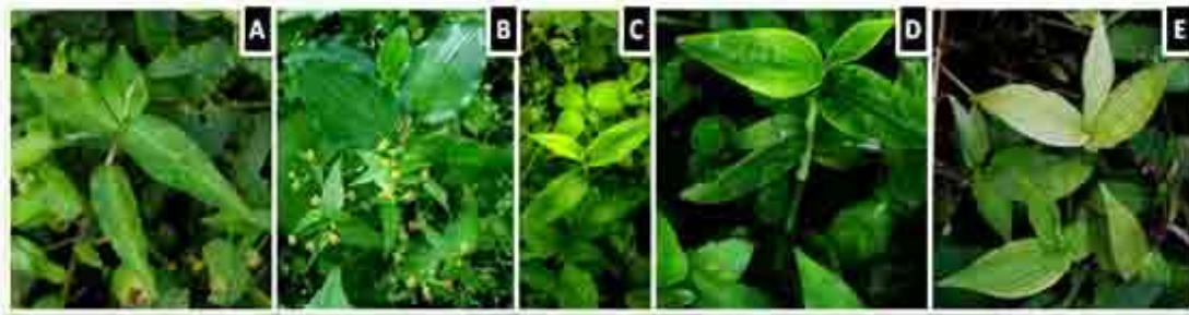
Gambar 1. Karakteristik gejala mosaik pada gulma Commelina spp.