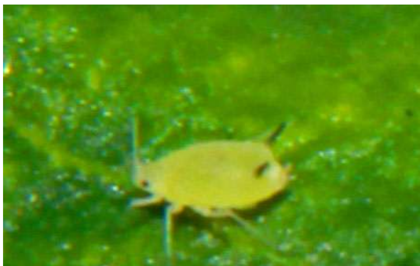
Gambar 1. Imago M. persicae (Pembesaran 100 x)

Hasil penelitian di lapangan menunjukkan ciri-ciri M. persicae yaitu kutu daun yang berwarna kuning kehijauan atau kemerahan. Baik kutu muda (nimfa atau aptera) maupun dewasa (Imago atau alatae) mempunyai antena yang relatif panjang, kira-kira sepanjang tubuhnya. Panjang tubuh \pm 2 mm, tubuh lunak seperti buah pir (Tarumingkeng, 2001).