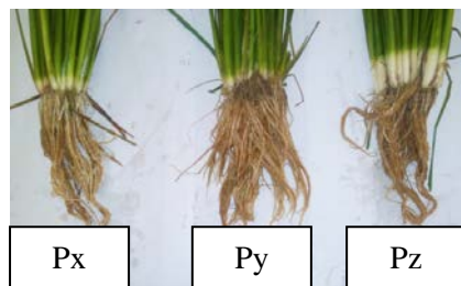
Gambar 2. Pertumbuhan akar tanaman padi Cigeulis umur 56 HST pada perlakuan Px, Py, dan Pz

Kandungan klorofil pada perlakuan Py selalu tertinggi untuk setiap pengamatannya. Pada pengamatan kandungan klorofil umur 56 HST, juga dilakukan pengamatan terhadap kondisi akar tanaman untuk masing-masing perlakuan. Perlakuan Py memiliki akar serabut lebih banyak dibandingkan Px dan Pz (Gambar 2), sehingga akar pada perlakuan Py mampu lebih optimal dalam penyerapan unsur hara. Akar yang bersimbiosis dengan E. cloacae mampu mengikat klorofil secara optimal sehingga akan meningkatkan kandungan N.