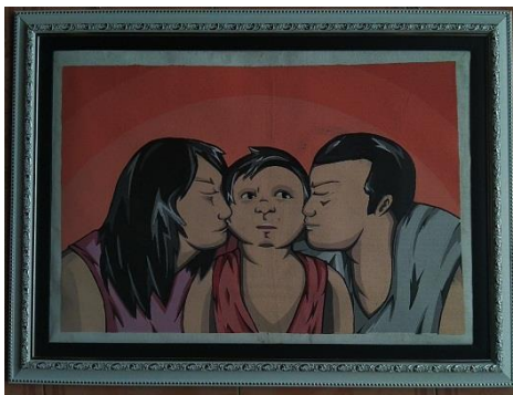
Kebahagiaan / 40 x 60 / Stencil Print / 2019