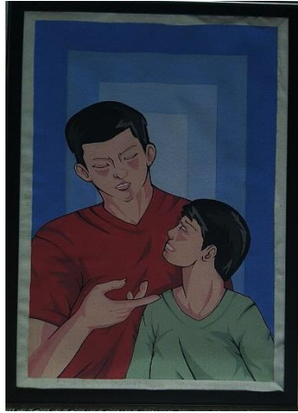
Motivasi / 40 x 60 / Stencil Print / 2019

Pada karya kedua ini penulis memvisualisasikan dua orang figure yang mana figure pertama dari sebelah kiri adalah seorang ayah dengan posisi merunduk sambil menatap anaknya yang sedang di atas pangkuan dengan ekspresi santai. Figure tersebut mengenakan baju kaus berwarna merah. Figure kedua dari sebelah kanan adalah seorang anak yang posisi anaknya menoleh ke atas yang sedang duduk di atas pangkuan ayahnya dengan ekspresi senang. Figure ini mengenakan baju kaus berwarna hijau.