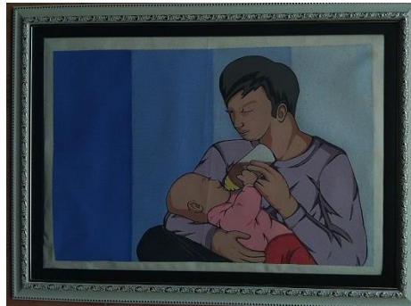
Peran Pengganti / 40 x 60 / Stencil Print / 2019

Pada karya ini memvisualisasikan dua orang figure manusia antara ayah dan anak bayi. Pada figure ayah sedang duduk bersila memangku dan menyusukan bayi tersebut dengan menggunakan alat bantu ASI. Dengan ekspresi senyum. Figure ini menggunakan pakaian kaus berlengan panjang berwarna ungu dan bercelana jeans biru dongker. Pada figure bayi kita juga bisa melihat ia sedang di pangku dan disusukan oleh ayahnya. Figure bayi ini mengenakan baju berlengan panjang dan celana panjang dengan warna pink dan merah bergradasi.