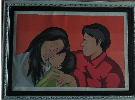
Kebersamaan / 40 x 60 / Stencil Print / 2019

Karya ini menggambarkan tiga orang figure manusia yaitu ibu, anak dan ayah yang posisi sebelah kiri terdapat seorang ibu yang menggunakan pakaian berwarna abu-abu yang sedang memeluk anaknya, figure anak tersebut divisualisasikan mengenakan pakaian kaus berwarna hijau.. Untuk figure seorang ayah memperlihatkan sedang mendekap istrinya dan anaknya dengan ekspresi tersenyum figure ini memakai baju kemeja berwarna merah mencolok.