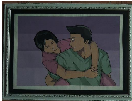
Kedekatan / 40 x 60 / Stencil Print / 2019

Pada karya kedua ini penulis memvisualisasikan dua orang figure yang mana figure pertama dari sebelah kiri adalah seorang ayah dengan posisi merunduk sambil menatap anaknya yang sedang di atas pangkuan dengan ekspresi santai . Figure tersebut mengenakan baju kaus berwarna merah. Figure kedua dari sebelah kanan adalah seorang anak yang posisi anaknya menoleh ke atas yang sedang duduk di atas pangkuan ayahnya dengan ekspresi senang , yang sedang mendengarkan menerima masukan dan arahan. Figure ini mengenakan baju kaus berwarna hijau.