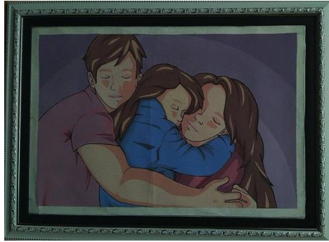
Kehangatan / 40 x 60 / Stencil Print / 2019

Pada karya ke empat ini penulis memvisualisasikan tiga orang figure. Figure yang pertama adalah seorang ayah yang sedang memeluk dua figure lainnya yaitu istri dan anaknya, figure ini mengenakan baju berwarna ungu dengan gradasi. Figure kedua ini adalah anak yang berada di tengah. Ekspresi dari anak ini sedang tertidur pulas. Figure ini mengenakan jaket berwarna biru gradasi. Figure ketiga adalah seorang ibu dimana ibu ini sedang memeluk anaknya yang berada di posisi tengah dan sedang menerima pelukan dari suaminya yang berada di posisi kiri. Figure ini mengenakan baju berwarna ungu dengan gradasi.