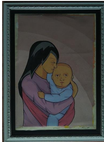
Harapan / 40 x 60 / Stencil Print / 2019

Pada karya ini mevisualisasikan dua orang figure yang mana figure utama adalah seorang ibu yang sedang menggendong anaknya menggunakan kain seperti sarung yang mana figure ini menyandarkan kepalanya ke kepala anaknya tersebut, figure ini mengenakan baju berwarna ungu dan kain sarung berwarna pink tua. Figure selanjutnya seorang anak yang sedang digendong oleh ibunya sambil tersenyum lebar. Figure ini mengenakan pakaian berwarna biru.