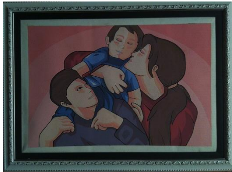
Keharmonisan / 40 x 60 / Stencil Print / 2019

Karya ini memvisualisasikan tiga orang figure manusia yaitu ayah ibu dan anak laki-lakinya. Figure ayah tampak tersenyum sambil menggendong anaknya di atas pundak dan edang mengenakan baju berwarna ungu.