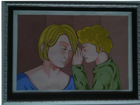
Komunikasi / 40 x 60 / Stencil Print / 2019

Pada karya ini memvisualisasikan dua orang figure manusia yaitu ibu dan anak saling bromuniasi. Pada figure ibu berada di posisi sebelah kiri dengan ekspresi senyum di wajah ibunya, figure ini sedang mengenakan pakaian berwarna biru dengan adanya gradasi.