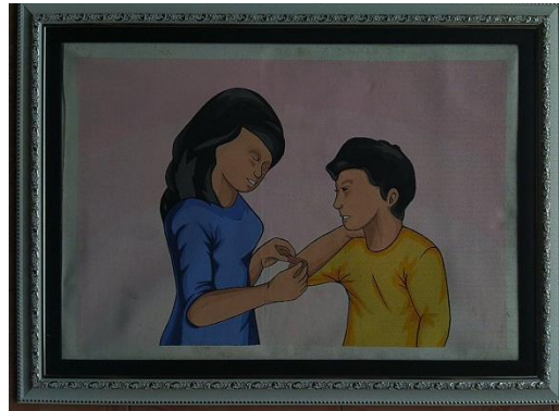
Perhatian / 40 x 60 / Stencil Print / 2019