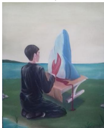
Gambar 5. Tidak wajar. 100 x 120 cm, akrilik pada kanvas, 2019. Sumber: Govinda

Karya lukis ke 5 ini diberi judul “Tidak Wajar” dengan ukuran 100cm x 120 cm yang menggunakan media kanvas dan cat akrilik. Pada lukisan ini terlihat ada beberapa subjek.