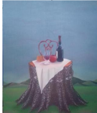
Gambar 8. Panjang umur . 100 x 120 cm, akrilik pada kanvas, 2019. Sumber: Govinda

Karya ini berjudul “Panjang Umur” dengan ukuran 100cm x 120 cm. Menggunakan media kain kanvas dan cat akrilik. Pada lukisan tersebut terlihat sebuah pohon yang dijadikan meja dengan alas berwarna putih. Pohon tersebut mempunyai beberapa mata, sengaja penulis buat untuk membangun kesan rupa seperti di alam mimpi.