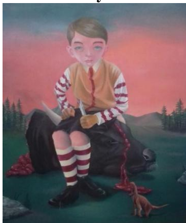
Gambar 2. Pudar . 100 x 120 cm, akrilik pada kanvas, 2019.

Karya lukis ini berjudul "Pudar" yang berukuran 100cm x 120 cm. Lukisan tersebut menampilkan seorang anak laki-laki yang berpakaian ikonik