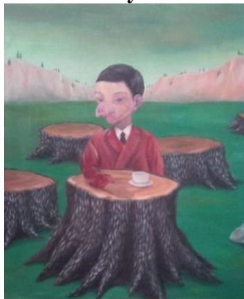
Gambar 3. Tak pernah cukup. 100 x 120 cm, akrilik pada kanvas, 2019. Sumber: Govinda

Karya lukis ini berjudul “Tak Pernah Cukup” berukuran 100 cm x 120 cm menggunakan media kanvas dan cat akrilik. Pada lukisan ini terlihat seorang anak laki-laki yang berhidung babi dan berpakaian jas berwarna merah. Anak laki-laki