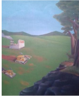
Gambar 9. Penjelajah . 100 x 120 cm, akrilik pada kanvas, 2019.

Makna dari lukisan yang berjudul “Penjelajah” yaitu mengenai perilaku manusia yang tanpa henti merusak hutan dan seisinya, dengan membangun dan terus membangun, sehingga gedung-gedung menutupi hijaunya hutan. Jika sesuatu dilakukan secara berlebihan, maka akan berakibat buruk nantinya.