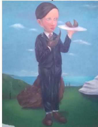
Gambar 6. Pelayan larangan. 100 x 120 cm, akrilik pada kanvas, 2019. Sumber: Govinda

Karya lukis ini berjudul “Pelayan Larangan” berukuran 100 cm x 120 cm dengan menggunakan media kanvas dan cat akrilik. Terlihat figur seorang laki-laki dengan memakai jas hitam, celana hitam, lengkap dengan sepatunya yang sedang memegang piring yang terdapat cula badak di atasnya. Terlihat pada lukisan tangan kanan laki-laki tersebut menyerupai kepiting, dibelakang laki-laki tersebut terlihat badak yang telah dibantai dan cularnya telah dilepas.