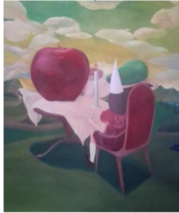
Gambar 1. Selamat merayakan . 100 x 120 cm, akrilik pada kanvas, 2019.

Karya ini menampilkan seorang anak perempuan yang duduk di kursi sambil memegang pisau, dilukiskan pada media kanvas dengan berukuran 100cm x 120cm. Figur anak perempuan terlihat memakai gaun mini berwarna merah gelap dengan memakai sepatu balet, kaos kaki, dan memakai sebuah topi perayaan. Terdapat subjek lain yang berupa 4 meja berwarna cokelat yang dialas dengan kain berwarna cream yang terlihat sederhana, dan di atas masing-masing meja tersebut terdapat buah apel, pisang, pepaya, lilin, dan daging dengan ukuran yang tidak normal. Keseimbangannya dibuat dengan terlihat penempatan figur di sebelah kanan dengan menghadap ke sisi kiri lukisan dan diimbangi dengan meja dan buah disisi sebelah kiri lukisan tersebut. Pemberian warna-warna pada lukisan ini terlihat kontras antara subjek yang satu dengan subjek yang lainnya