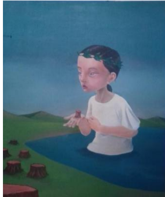
Gambar 10. Ibu . 100 x 120 cm, akrilik pada kanvas, 2019. Sumber: Govinda Perempuan fiksi yang penulis maksud di dalam lukisan "Ibu" bermakna

sebagai Ibu Pertiwi di Indonesia. Ketika orang-orang Indonesia semakin gila merusak alam dari lautan sampai daratan, mengambil semuanya tanpa mempertimbangkan dampaknya dan ketika semua tentang alam terus dihabiskan manusia dengan cara yang tidak wajar, dimana setelah semua itu porak-poranda yang akan merasakan dampaknya ialah manusia itu sendiri. Penulis disini hanya mengingatkan kepada masyarakat betapa pentingnya untuk menjaga keseimbangan ekosistem alam. Sebab hidup tidak untuk satu generasi, tetapi manusia hidup dengan terus bergenerasi, dan begitu seterusnya.