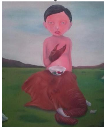
Gambar 4. Pemburu . 100 x 120 cm, akrilik pada kanvas, 2019. Sumber: Govinda

Karya lukis ini berjudul “Pemburu” dengan ukuran 100 cm x 120 cm dengan media kanvas dan cat akrilik. Pada lukisan tersebut terlihat seorang anak laki-laki yang bertelanjang dada dengan tangan kanannya menyerupai kepiting sehingga menyerupai makhluk alam mimpi, dan anak pada lukisan tersebut memandang kosong ke depan. Terlihat gajah yang telah dibantai dengan gading yang telah patah. Sementara itu, di atas kepala gajah terlihat sebuah mangkok bergambar ayam.