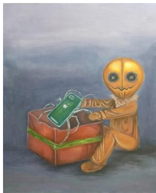
Gambar 25. Hadiahku /Akrilik di atas Kanvas/100 x 120 cm/2019 Sumber : Annisa Tri Utami

Karya berjudul “ Hadiahku “ ini terinspirasi dari fenomena kecanduan gadget yang penulis amati di kalangan masyarakat, terutama pada para remaja. Merasa gadget adalah kebutuhan yang harus dipenuhi maka orang tua memberikan apa yang menjadikan keinginan anaknya tanpa melakukan pengawasan terhadap pemakaian gadget tersebut.