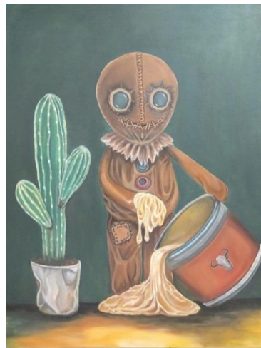
Gambar 2. Main Lem / Akrilik di atas Kanvas/100 x 130 cm/2019

Karya yang berjudul “Main lem“ ini menampilkan sebuah boneka dengan gestur sedang menyulingkan sekaleng lem dengan lambang tengkorak banteng dan memainkannya. Di samping boneka terdapat sebuah pohon kaktus yang