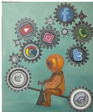
Gambar 23. Salah Guna /Akrilik di atas Kanvas/100 x 120 cm/2019