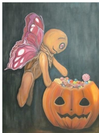
Gambar 5. Makan Malam / Akrilik di atas Kanvas/100 x 130 cm/2019 Sumber : Annisa Tri Utami