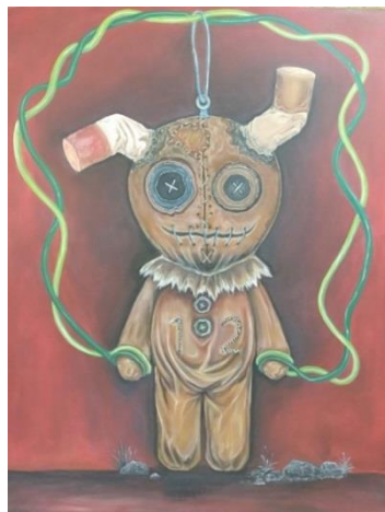
Gambar 1. Pegang Kendali / Akrilik di atas Kanvas /100 x 130 cm/2019

Karya pertama berjudul “ Pegang Kendali “ ini menampilkan sebuah boneka berwarna coklat seolah sedang berjalan dengan memegang dua buah tali saling berkait yang diberi warna hijau muda dan hijau tua. Di kepala boneka tampak dua buah puntung rokok yang ujungnya diberi warna berbeda yaitu merah dan coklat. Penulis juga menambahkan batu kerikil dan rumput di bagian bawah serta pemberian warna background yaitu merah kehitaman yang lebih digelapkan di daerah sekitar boneka.