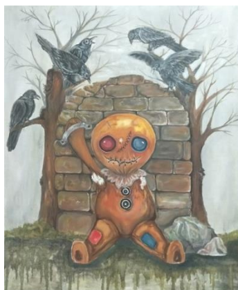
Gambar 24. Bullying/Akrilik di atas Kanvas /100 x 120 cm/2019

Karya ini berjudul “ Bullying” Secara visual kasus bully ini penulis gambarkan dengan bentuk boneka yang hanya memiliki satu tangan berada dalam