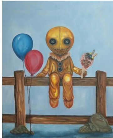
Gambar 27. Penyendiri /Akrilik di atas Kanvas/100 x 120 cm/ 2019

Karya yang berjudul “Penyendiri“ ini memperlihatkan sebuah boneka yang sedang duduk sendirian di atas pagar kayu berwarna coklat sambil memegang es krim yang sudah diberi aksesoris bayangan tengkorak dari lelehan es krim tersebut. Di samping boneka terdapat dua balon berwarna biru dan merah. Di bagian bawah terdapat batu yang menyangga pagar kayu tersebut. Pada background penulis memberi gradasi warna biru.