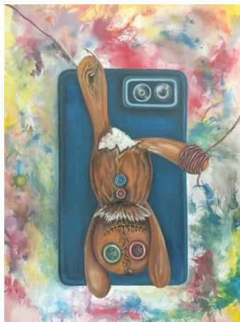
Gambar 3. Hasrat Viral/ Akrilik di atas Kanvas/100 x 130 cm/2019

Karya berjudul “Hasrat Viral” ini secara visual penulis menggambarkan subjek boneka digantung terbalik dengan keadaan salah satu kaki terkait oleh mata kail dan kaki lainnya terjerat oleh tali berwarna merah, dan di belakang boneka tersebut terdapat kamera ponsel.