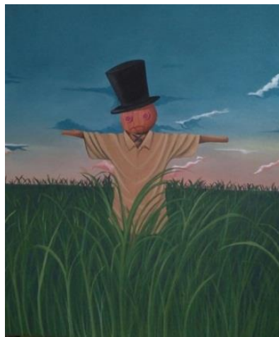
Gambar 5. Melihat Namun Tidak Menyentuh. 100 cm x120 cm, akrilik pada kanvas, 2019.

Lukisan ini berjudul “Melihat Namun Tidak Menyentuh” yang berukuran 100 cm x 120 cm ini menampilkan sosok orang-orangan sawah yang berada di tengah ilalang yang rimbun dan tinggi. Orang-orangan sawah ini berpakaian