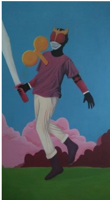
Gambar 9. Pahlawan mainan. 100 cm x 120 cm, akrilik pada kanvas, 2019.

“Pahlawan Mainan” yaitu lukisan yang berukuran 100 cm x 160 cm pada kanvas ini merupakan karya yang menampilkan sosok lelaki yang mengenakan topeng pahlawan dengan pakaian kaos dan celana biasa. Figur ini seakan melangkah untuk bergerak kedepan, dengan menggenggam pedang pada tangan kanannya. Latar tempat pada karya ini berlatar biru dengan awan yang berwarna ungu. Pada bagian dada dari figur ini terdapat sebuah skrup pemutar mainan yang berukuran besar.