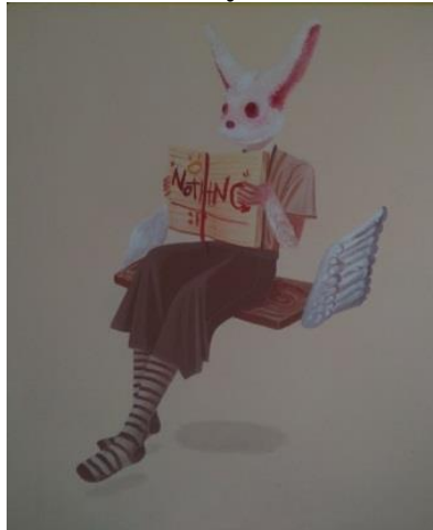
Gambar 7. Di Atas Angin. 100 cm x 120 cm, akrilik pada kanvas, 2019.

Lukisan yang berjudul “Di Atas Angin” ini menampilkan sosok wanita yang duduk di atas buaian sembari menggenggam sebuah buku, karya ini berukuran 100 cm x120 cm pada kanvas. Dalam karya ini subjeknya adalah seorang wanita berkepala kelinci yang matanya dijahit, wanita tersebut tengah duduk di atas sebuah buaian yang bersayap, wanita ini terlihat sedang membaca sebuah buku yang terbalik, pada lembar halaman buku tersebut bertuliskan tulisan Nothing.