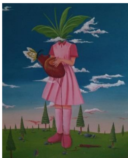
Gambar 6. Sebuah Jantung. 100 cm x 120 cm, akrilik pada kanvas, 2019.