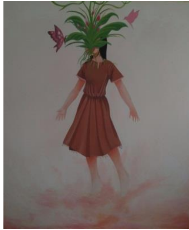
Gambar 8. Nilai Pada Perbedaan. 100 cm x 120 cm, akrilik pada kanvas, 2019.

Karya lukis ini berjudul “Nilai Pada Perbedaan” dengan ukuran 100 cm x 120 cm dengan media cat akrilik pada kanvas. Lukisan ini menampilkan sosok figur seorang wanita yang melayang dengan tumbuhan yang tumbuh dimukanya. Lukisan ini hanya memiliki subjek tunggal yang ditambah dengan subjek pendukung kupu-kupu dan burung. Lukisan ini berlatarkan sebuah bentuk ruang hampa yang berkabut. Ruang hampa ini berwarna pastel lembut yang merujuk pada kesan manis dan feminim pada wanita. Tubuh wanita ini melayang dengan keadaan meregangkan kedua tangannya, wanita ini tidak memiliki wajah, dimana wajahnya bolong yang kemudian tumbuh dedaunan dan bunga.