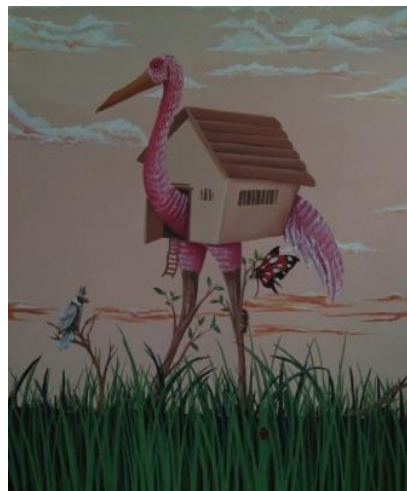
Gambar 4. Tentang Rumah. 100 cm x 120 cm. Akrilik pada kanvas, 2019. Sumber: Erik

Karya ini menampilkan seekor burung bangau berkaki panjang yang sedang menyanggah sebuah rumah, lukisan ini berukuran 100 cm x 120 cm pada media kanvas. Bangau ini berwarna merah muda dengan ukuran leher yang panjang dan tengah menyanggah sebuah rumah. Burung bangau ini memiliki kaki yang menyerupai ranting pohon. Terdapat hewan lain seperti kupu-kupu dan seekor burung kecil didekat bangau tersebut. Lukisan yang berjudul “tentang rumah” ini berlatarkan tempat disebuah semak-semak, dengan suasana waktu di sore hari.