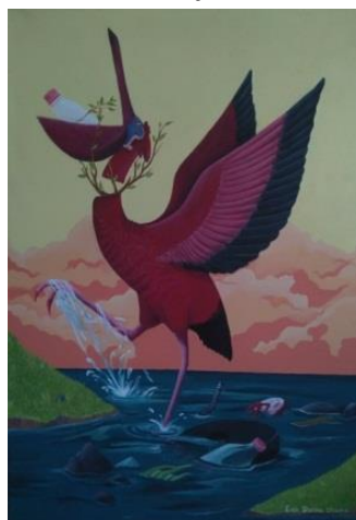
Gambar 2. Semua Ulah Kita. 100 cm x 120 cm, akrilik pada kanvas, 2019. Sumber: Erik