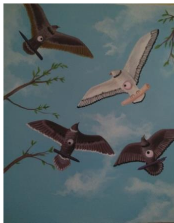
Gambar 10. Kabar Burung. 100 cm x 120 cm, akrilik pada kanvas, 2019.

Lukisan yang berjudul “Kabar Burung” ini berukuran 100 cm x 120 cm dengan media cat akrilik pada kanvas, dalam lukisan ini menampilkan 4 ekor burung yang terbang di langit dengan perspektif dari bawah ke atas . Dalam karya ini 3 burung berwarna hitam dan 1 burung berwarna putih. Dengan latar warna