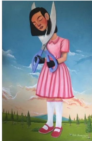
Gambar 1. Seperti Apa Hari Esok?. 100 cm x 150 cm, akrilik pada kanvas, 2019.

Lukisan ini menampilkan sosok wanita yang memegang gunting berukuran raksasa, pada kanvas yang berukuran 100 cm x 150 cm. Figur pada lukisan tersebut adalah seorang wanita yang berperawakan muka wanita dewasa dengan ukuran tubuh seperti anak-anak. Pakaian yang digunakannya berwarna merah muda dengan tampilan gaya klasik. Dalam lukisan ini sosok figur memiliki leher yang panjang, wanita ini memegang gunting yang berukuran besar dengan memakai sarung tangan berwarna hitam, dengan berlatarkan tempat yang dipenuhi