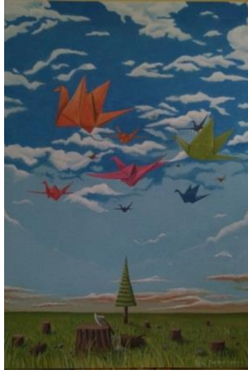
Gambar 3. Pohon Terakhir. 100 cm x 120 cm, akrilik pada kanvas, 2019.

Karya ini menampilkan visual di padang rumput di mana pepohonan telah habis ditebang dan menyisakan satu pohon, kemudian pada langitnya bertebaran origami burung yang jumlah cukup banyak. Lukisan ini berukuran 100 cm x120 cm. Dalam lukisan ini memiliki pola yang kontras antara visual bagian atas dan bawah.