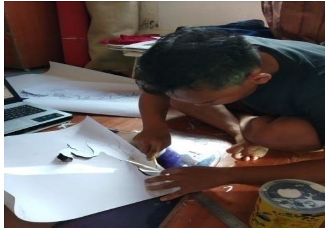
Gambar 1 : Mencetak (Eki Wirahman 2019)

Langkah 1 memotong/melubangi background yang ada, dengan menggunakan cutter secara teliti dan bersih agar object yang kita potong sesuai dengan yang kita inginkan.