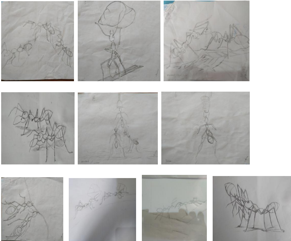
Gambar 11 : Sketsa (Eki wirahman 2019)