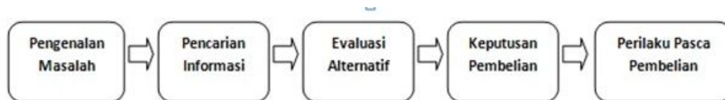
Gambar 1. Model Lima Tahap Proses Pengambilan Keputusan Sumber: Kotler (2008:179)

Perilaku konsumen akan mempengaruhi proses pengambilan keputusan. Kotler (2008:204) menjelaskan proses pengambilan keputusan pembelian terdiri dari 5 tahapan yaitu, menganalisis keinginan dan kebutuhan, pencarian informasi dan penilaian sumber-sumber pembelian, dan seleksi terhadap alternatif pembelian, keputusan untuk membeli dan perilaku sesudah pembelian.