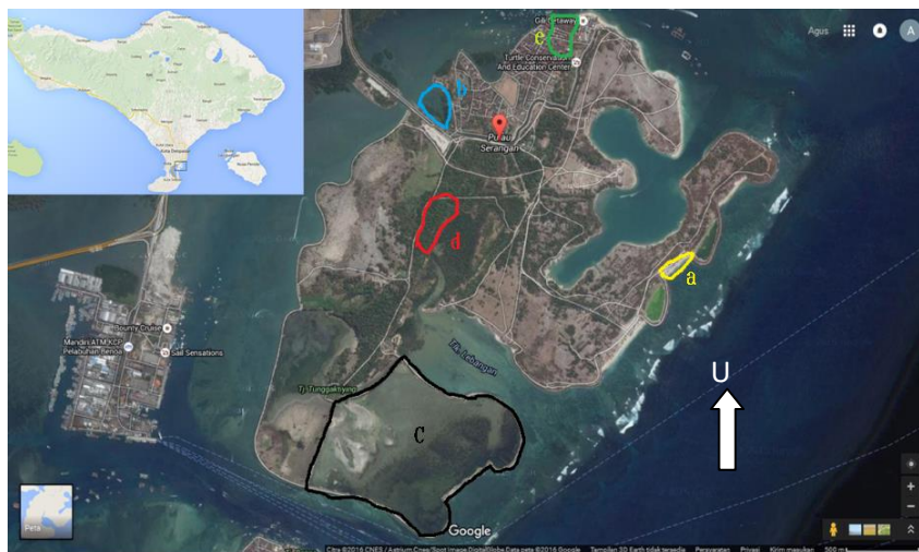
Gambar 1. Peta Lokasi penelitian di Pulau Serangan (Google map) (Keterangan : a. pantai b. mangrove c. laguna d. hutan tanaman e. pemukiman Skala : 1:500)

dilakukan pengamatan sebanyak 4x (2x pagi dan 2x sore). Waktu yang dipakai pengamatan yakni pada pagi hari (06.00-09.00 WITA) dan sore hari (15.00-18.00 WITA). Pemilihan lokasi pengamatan yang dilakukan secara acak.