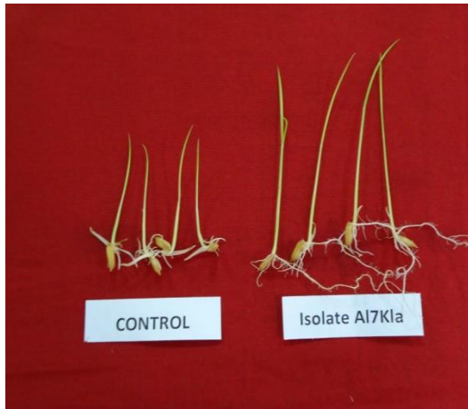
Gambar 1. Perbandingan padi yang diberikan perlakuan bakteri isolat A17Kla (kanan) dan kontrol (kiri)

menginduksi ketahanan tanaman secara sistemik (Fernando et al. , 2005, Cattelan et al. , 1999; Wei et al. , 1996).