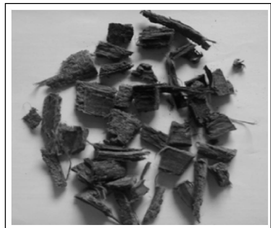
Gambar 1. Kulit Batang Cempaka Kuning

Hasil pengamatan makroskopis kulit batang cempaka kuning ditampilkan pada Gambar 1. Pada pengamatan makroskopis terlihat simplisia berwarna coklat tua, berbau aromatis, berbentuk potong-potongan atau kepingan dengan bagian dalam berserat, dan keras.