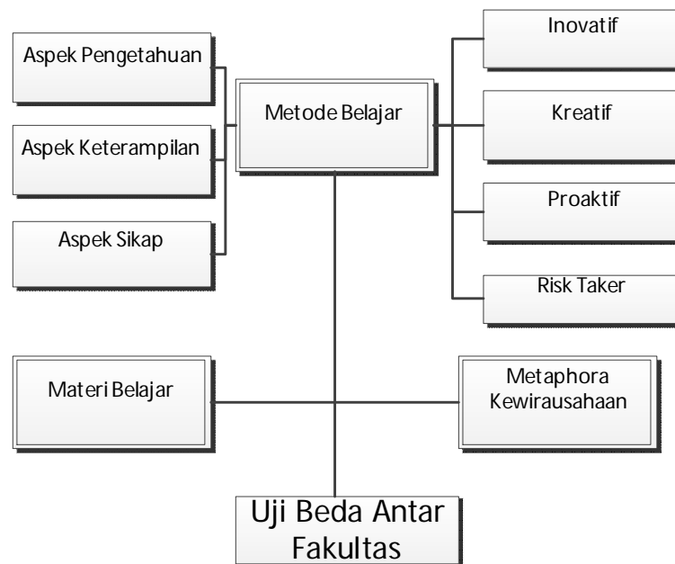
Gambar 2. Kerangka Penelitian Empirik

Penting dilakukan penelitian empirik dilingkungan akademik untuk menguji apakah setiap program studi pada beberapa universitas melakukan hal yang sama atau berbeda dari sisi konten dan metode pembelajaran. Penting untuk memberi rekomendasi bahwa kurikulum kewirausahaan merupakan kurikulum mayor yang dapat dilaksanakan pada tingkat univerisitas sebagai mata kuliah yang termasuk dalam Mata Kuliah Dasar Utama yang diberikan untuk setiap prodi dengan kurikulum dan sasaran belajar yang relatif sama. Penelitian akan menempatkan bagaimana penerapan kurikulum kewirausahaan dalam proses pembelajaran pada program studi yang pada tingkat universitas. Secara spesifik penelitian ini akan menjelaskan apakah materi ajar kewirausahaan telah mampu merefleksikan capaian pembelajarannya. Selanjutnya kerangka penelitian empirik ditunjukkan pada Gambar 2.