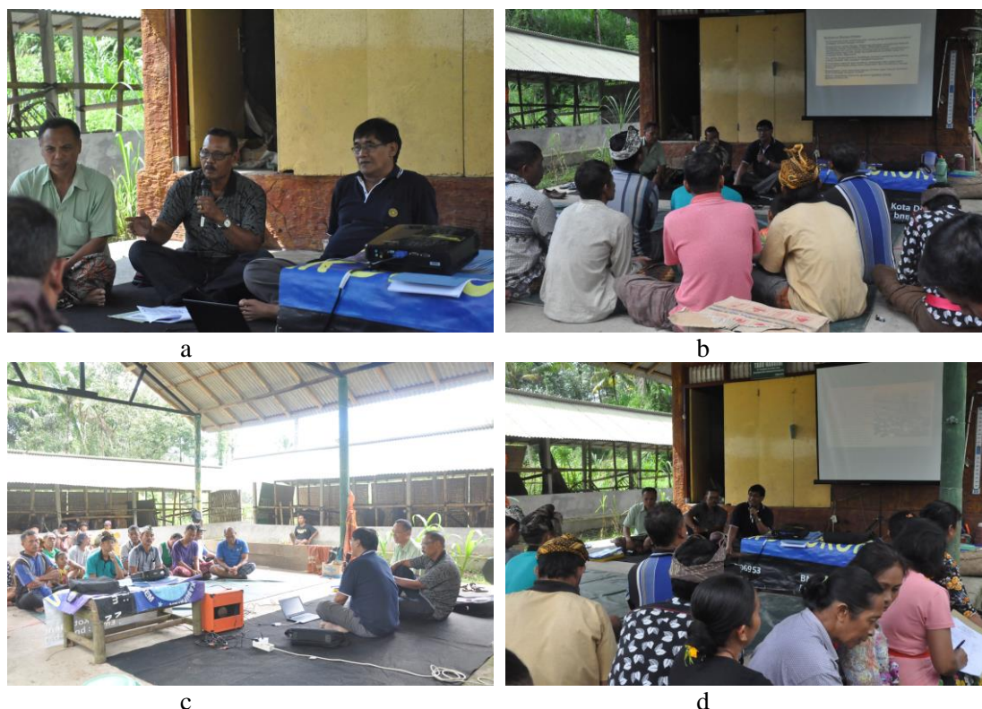
Gambar 1. Pelaksanaan Pelatihan Pengendalian Penyakit Busuk Berair Pada Buah Salak Di Desa Duda Timur, Kecamatan Selat, Kabupaten Karangasem (a-d).

buah terdiri dari tiga segmen, kemungkinan pertama 1-3 segmen induk dan kemungkinan kedua satu segmen induk dan dua segmen anak (Guntoro, dkk. 1998).