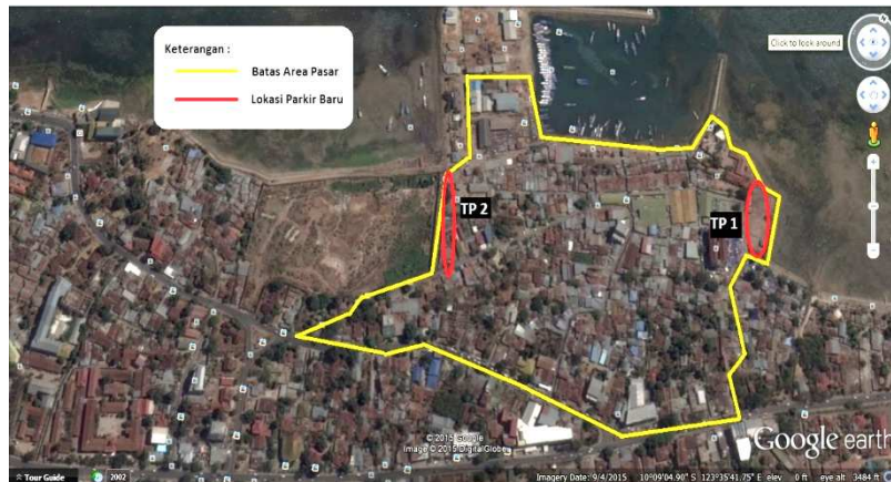
Gambar 2. Lokasi Parkir TP1 dan TP2

Untuk memenuhi kebutuhan akan ruang parkir di dalam pasar, maka pemerintah telah menyediakan 2 lokasi parkir yang baru yaitu TP1 dan TP2. Lokasi parkir TP1 dan TP2 dapat dilihat pada Gambar 2.