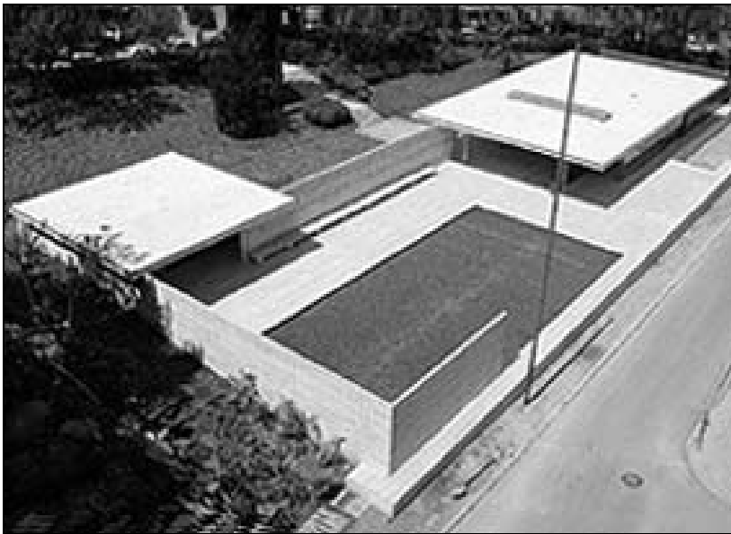
Gambar 2. The Barcelona Pavilion dirancang oleh Ludwig Mies van der Rohe (1886-1969) yang difungsikan sebagai The German National Pavilion for the 1929 Barcelona International Pavilion pada Barcelona International Exhibition, 1929. Dianggap sebagai salah satu produk adiknya pada masa Modernism, citra ruang yang lugas menampilkan sosok Flowing Spaces yang konseptual. Selama beberapa dekade rancangan ini memberikan inspirasi pada para arsitek & desainer interior diseluruh dunia.

Dalam konteks perluasan makna, dapat dikatakan bahwa post-modern memberi harapan yang besar, namun jika ditinjau lebih kritis, tersirat suatu pertanyaan, dimana makna tentang ruang yang hakiki tersebut? Ruang sebagai titik sentral dari desain interior dan arsitektur, dan selama berabad-abad mempunyai kedudukan yang kritis dalam berfikir desain menjadi kabur.