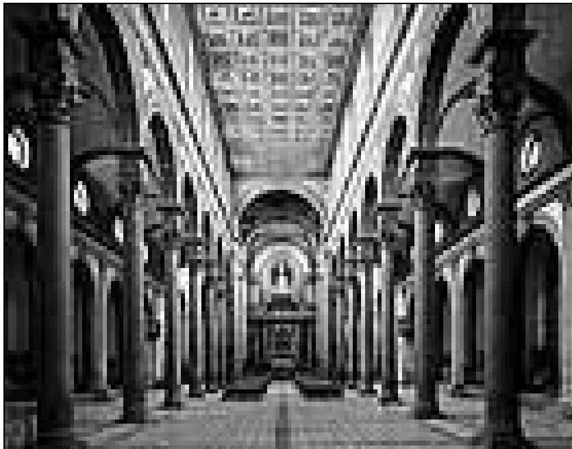
Gambar 1. Order merupakan suatu perbendaharaan istilah yang penting dalam desain dan arsitektur abad pertengahan, hal ini dapat dilihat pada The centre nave in St. Lorenzo (1423), karya dari Filippo Brunelleschi (1377-1446). Berpikir order identik dengan hakikat ruang dalam interior dan arsitektur selama berabad-abad kemudian

Pergeseran pandangan terhadap ruang, kemudian diterjemahkan kedalam wujud arsitektural dengan berbagai keunikan, karena disamping berpegang teguh kepada nilai budaya yang berlaku, juga mengacu kepada idiom-idiom estetika dengan parameter yang relatif. Menjelang fase modernisme, berbagai ide estetik banyak terjebak kepada pola-pola berfikir tiga dimensional yang terkadang memberikan impresi teknis yang sangat bersifat materialistik.