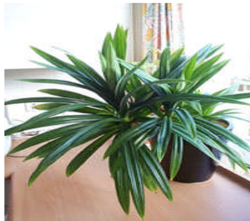
Gambar 1. Tumbuhan Pandan Wangi

Daun pandan wangi yang telah dikeringkan dan dihaluskan, direndam (dimaserasi) selama 3 x 24 jam, disaring dan dipisahkan dalam rotary evaporator (40-65 °C, 60 rpm).