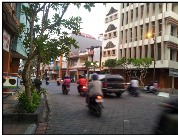
Gambar 3 Kondisi Perkerasan (Paving) Jalan Gajah Mada - Denpasar