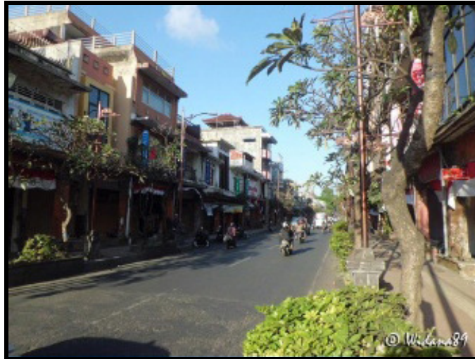
Gambar 2 Kondisi Perkerasan Awal (Aspal) Jalan Gajah Mada – Denpasar

biaya pemeliharaan perkerasan paving dengan asumsi bahwa volume lalu-lintas dianggap sama dan biaya-biaya informal lainnya, seperti biaya penutupan jalan diabaikan.