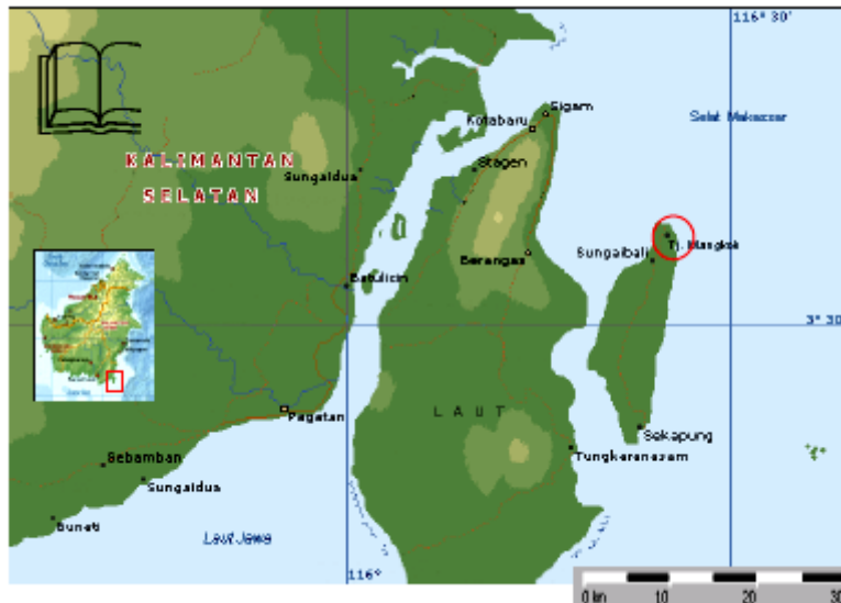
Gambar 1. Peta Lokasi Penelitian (Lingkaran Merah)

latan berbatasan dengan Desa Rampa dan Sungai Bali; Sebelah Timur berbatasan dengan Selat Makasar; dan Sebelah Barat berbatasan dengan Selat Sebuku.