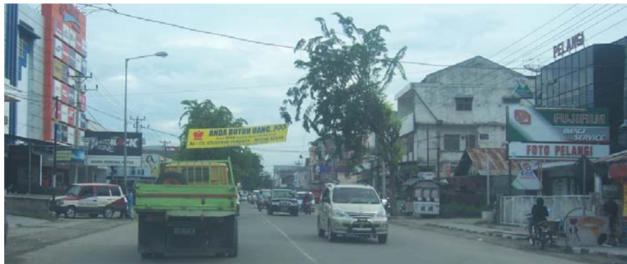
Gambar 2. Jalan W. Monginsidi Kota Palu