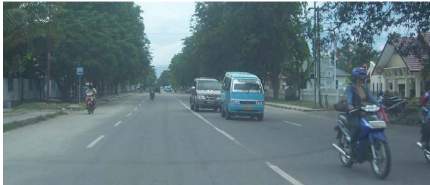
Gambar 3. Jalan Sam Ratulangi Kota Palu