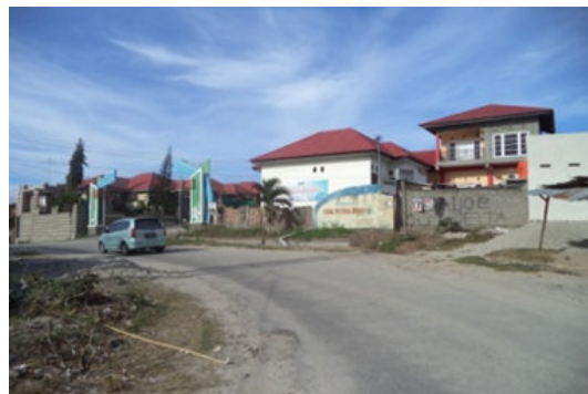
Gambar 1. Peta Lokasi Studi

Lokasi terbagi atas dua perumahan yaitu :