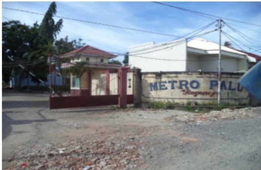
Gambar 2. Peta Lokasi Studi