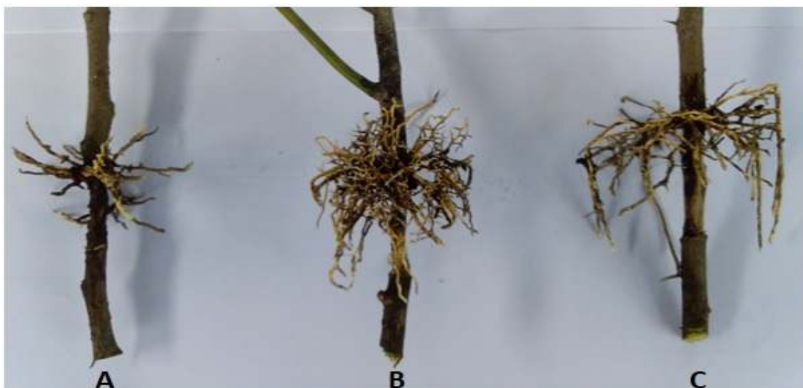
Gambar 1. Pembentukan akar pada cangkok kalamansi 2 bulan setelah aplikasi perlakuan: A). Kontrol tanpa pemberian ZPT, B). Rootone F (P1), C). Pasta kayu manis-madu (P2).

Fitohormon endogen (auksin) secara fisiologis dapat membantu mendorong perpanjangan sel, pembelahan sel, diferensiasi jaringan xylem dan floem, dan pembentukan akar (Ramadan et al. , 2016). Fitohormon endogen yang terdapat pada cangkok sudah cukup untuk menstimulasi pembentukan akar dan dapat tumbuh baik pada kondisi yang lebih aseptik. Kandungan antibakteri dan antijamur dari bahan kayu manis dan madu (Rao dan Gan, 2014; Albaridi, 2019) dapat mendukung kondisi perakaran cangkok yang lebih baik.