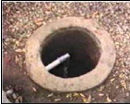
Gambar 3. Contoh Sumur resapan