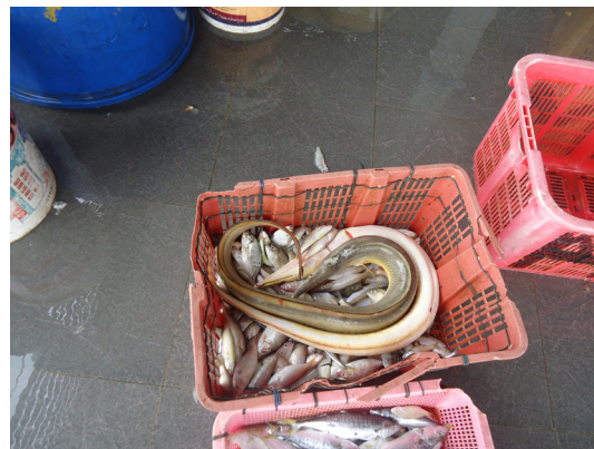
Figure 3 Daggertooth pike conger fish ( Muraenesox cinerus ) from fishermen.