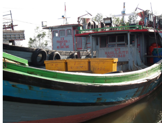
Figure 2 Type of fishermen boat in sampling area (Sungai Kakap and Sungai Pinyuh district).