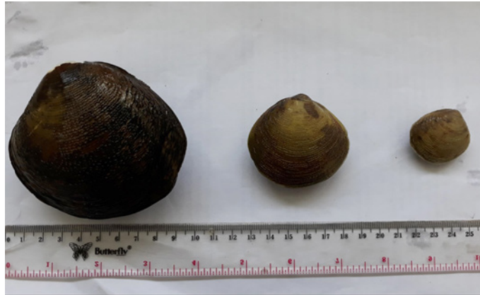
Gambar 2 Ukuran kerang totok ( G. erosa ) yang ditemukan di Segara Anakan bagian timur dan Sungai Donan, Cilacap.

(Figure 2 Mud clam ( G. erosa ) size found in east of Segara Anakan and west of Donan River, Cilacap)